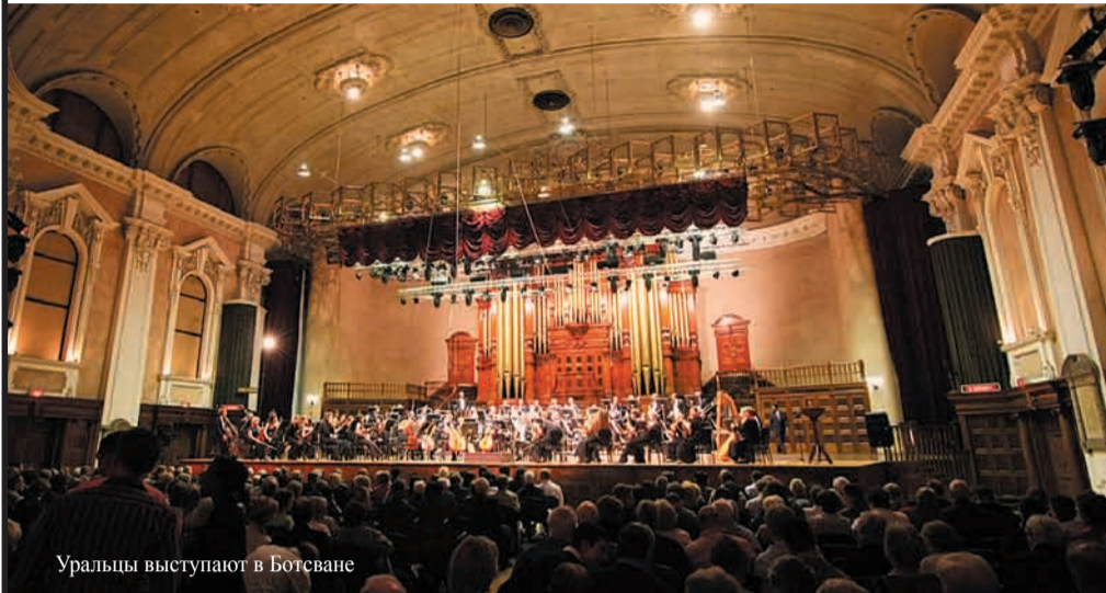
Уральцы выступают в Ботсване